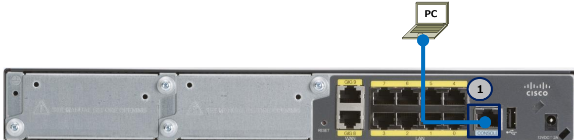
図 2 パスワードの回復で使用する構成 (C841M-8X-JAIS/K9 の場合)