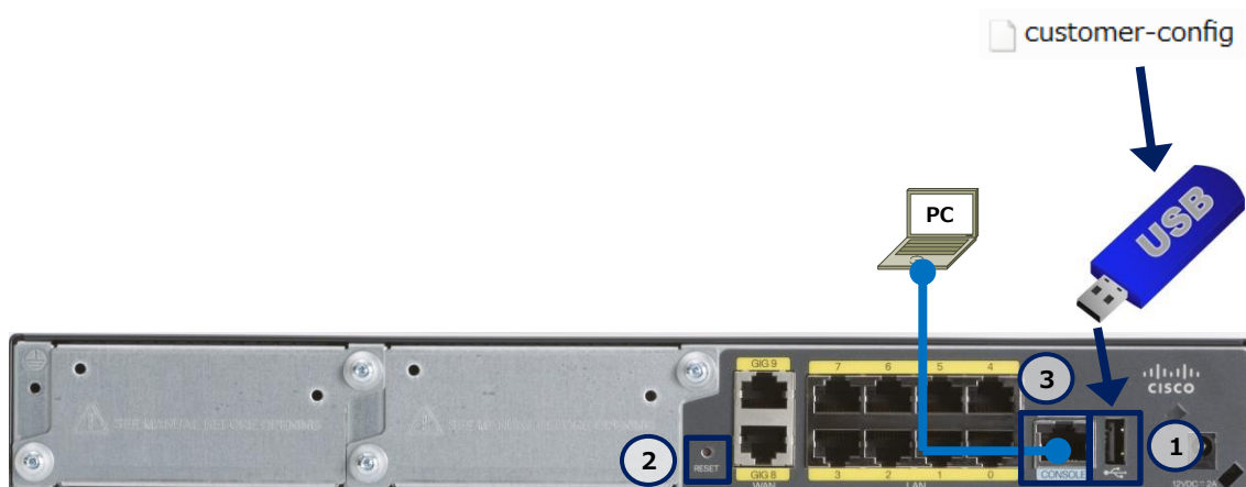
図 2 設定の初期化で使用する構成 (C841M-8X-JAIS/K9 の場合)

なお、本書ではデータストアとして USB メモリー、初期設定ファイルとして customer-config を使用します。また、初期化の進行状況と結果を確認するために、コンソールとして PC を使用します。