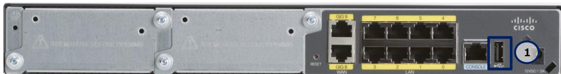
図 3 Cisco 841M Jシリーズの USB ポート (C841M-8X-JAIS/K9 の場合)