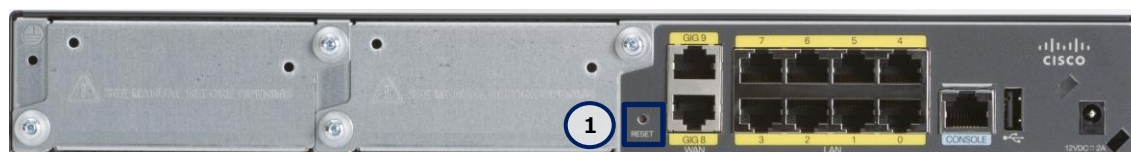
図 4 Cisco 841M J シリーズの RESET ボタン (C841M-8X-JAIS/K9 の場合)

*Jan 7 09:29:05.089: %SYS-5-RELOAD: Reload requested by Reset button de tect process. Reload Reason: Load customer configuration.